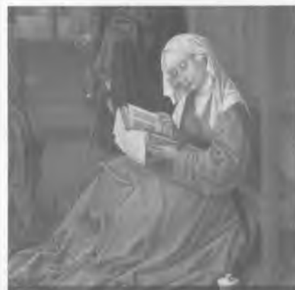
87 О тонкостях развивающего чтения.