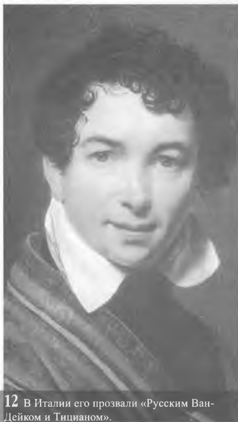
12 В Италии его прозвали «Русским Ван-Дейком и Тицианом».

50 ОДИН В ПОЛЕ НЕ ВОИН: СЕЛЬСКАЯ БИ- БЛИОТЕКА КАК СОЦИ- АЛЬНЫЙ ПАРТНЕР