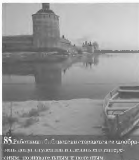
85 Работники библиотеки стараются разнообразить досуг студентов и сделать его интересным, познавательным и полезным.