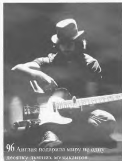
96 Англия подарила миру не одну десятку дивных музыкантов.