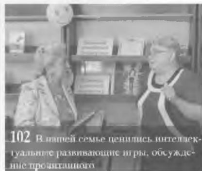
102 В нашей семье ценились интеллектуальные развивающие игры, обсуждения прочитанного